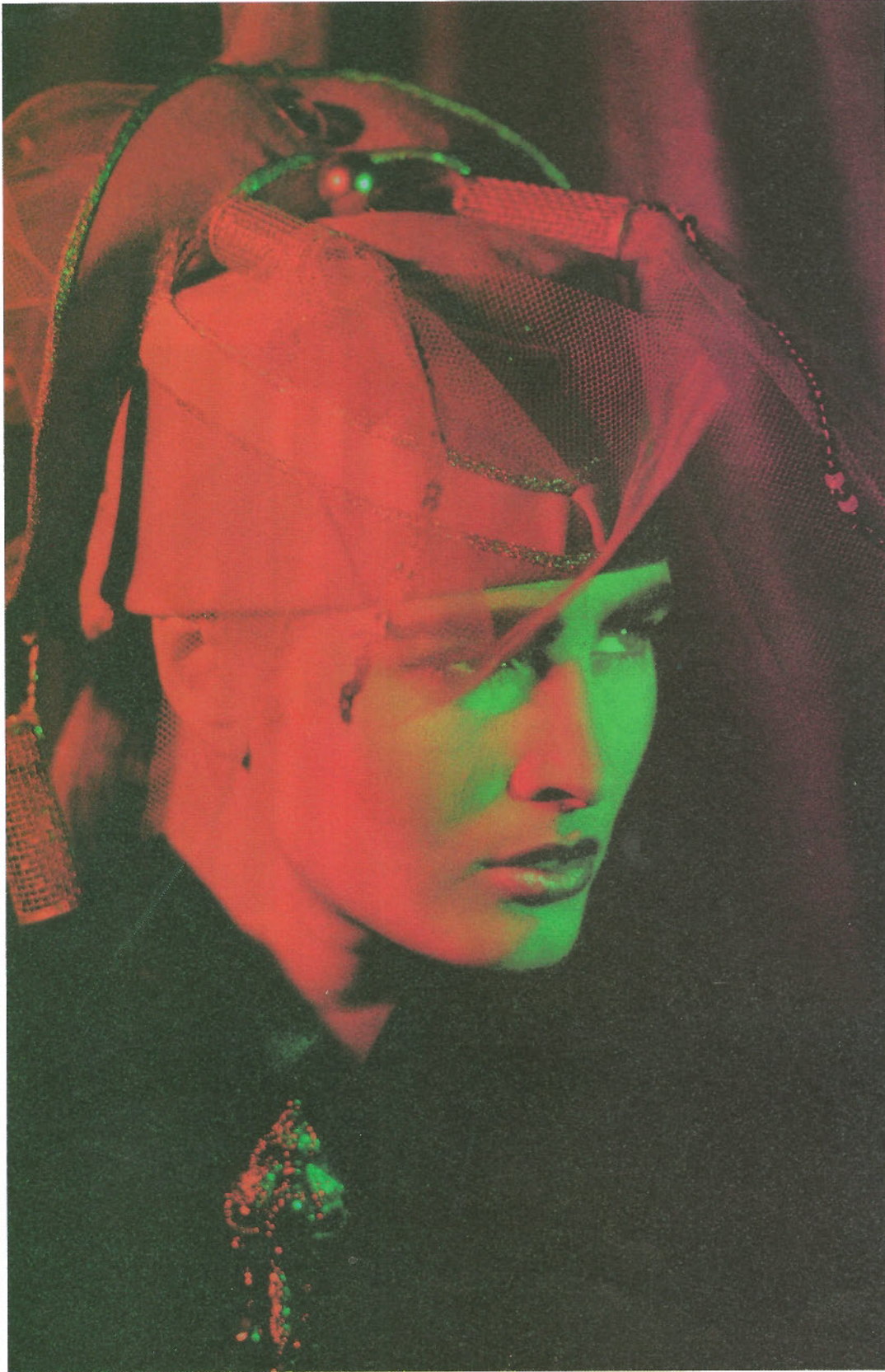
Nr. 462: „Lockenwicklerfilz“ in Altrosa, mit Tüll und Goldpaspelierung.